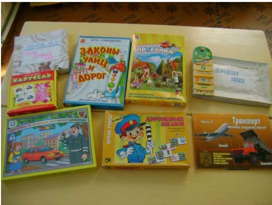
Оформление уголка ПДД в старшей группе