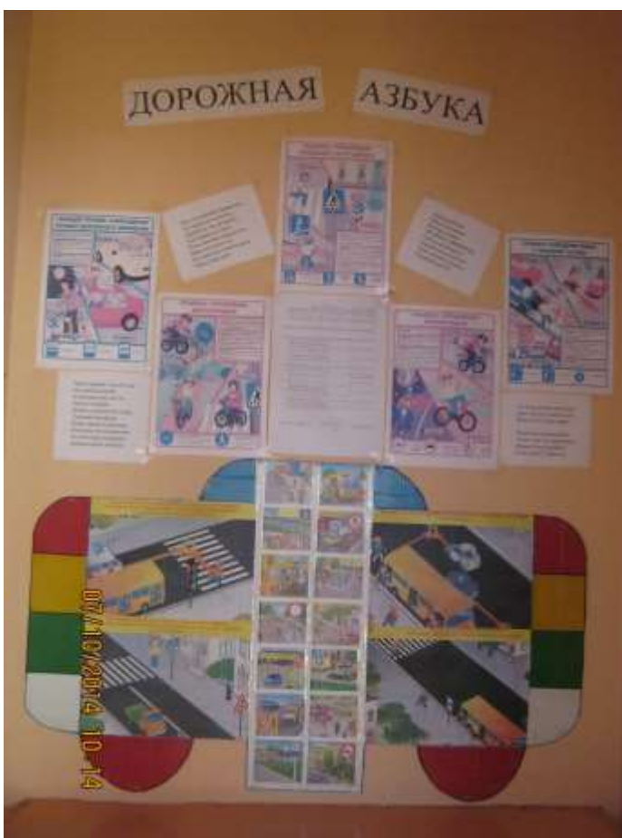
Неделя по ПДД на тему «Внимание - дорога» помогла закрепить имеющиеся у детей знания о правилах дорожного движения.