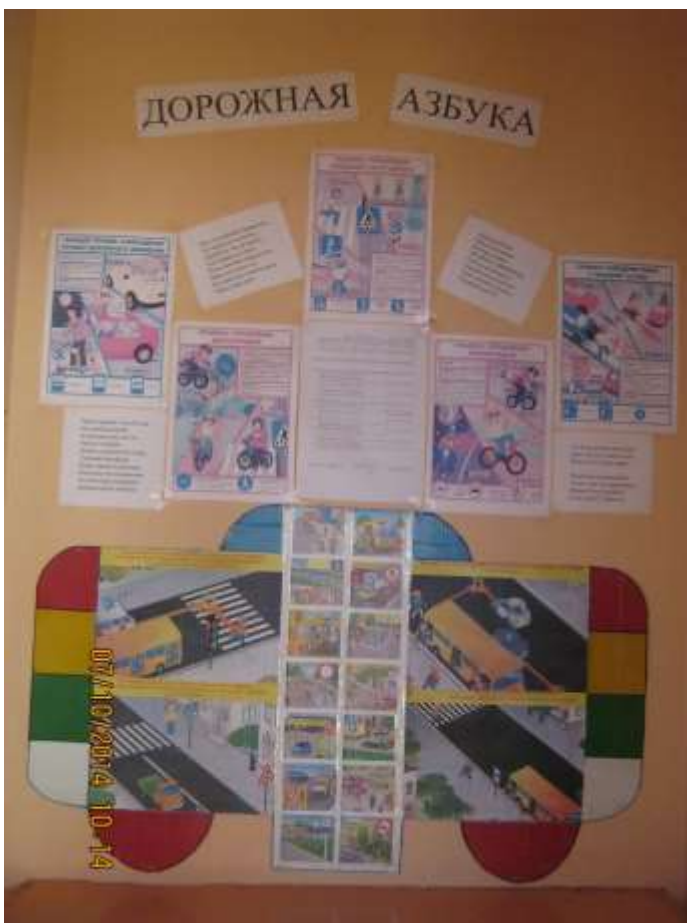
Неделя по ПДД на тему «Внимание - дорога» помогла закрепить имеющиеся у детей знания о правилах дорожного движения.